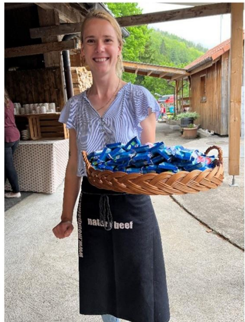
Jubiläumsanlass 10 Jahre VTSO auf dem Berghof Montpelon in Gännsbrunnen